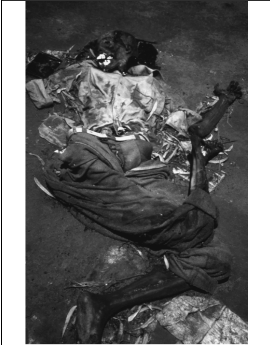
Kigali - juillet 1994