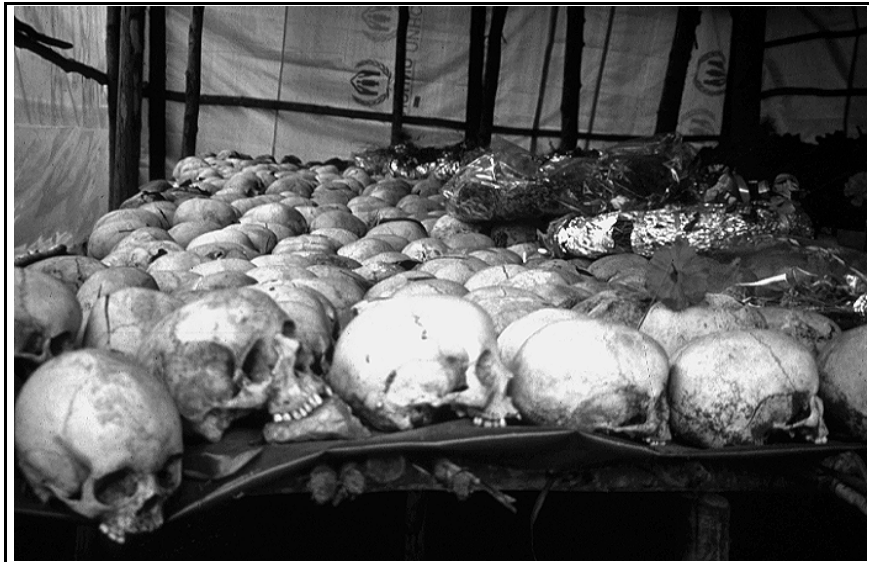
Eglise de Ntarama - juillet 1997